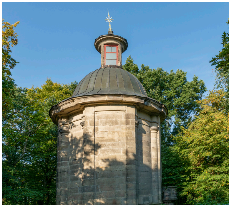
Kaple sv. Anny, Ostružno

Jičín – Podhradí ( 4368 – 4,9 km) – Chyjice ( 4368 – 9,3 km) – Údrnice ( 4368 – 18,9 km) – Libáň ( 4368 – 22,6 km) – Zelenecká Lhota (nezn. silnice – 26,8 km) – Markvartice (31,3 km) – Příklad (34,3 km) – Ostružno ( 4364 – 40,5 km) – Jičín ( 4364 – 46,1 km)