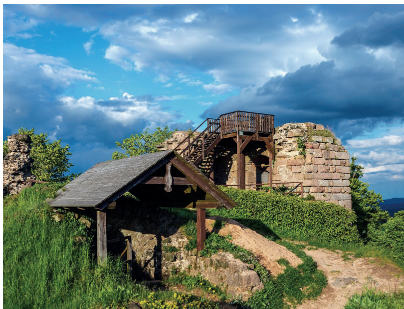
Zřícenina hradu Kumburk

Možnost návratu: z Lomnice nad Popelkou do Syřenova vlakem.