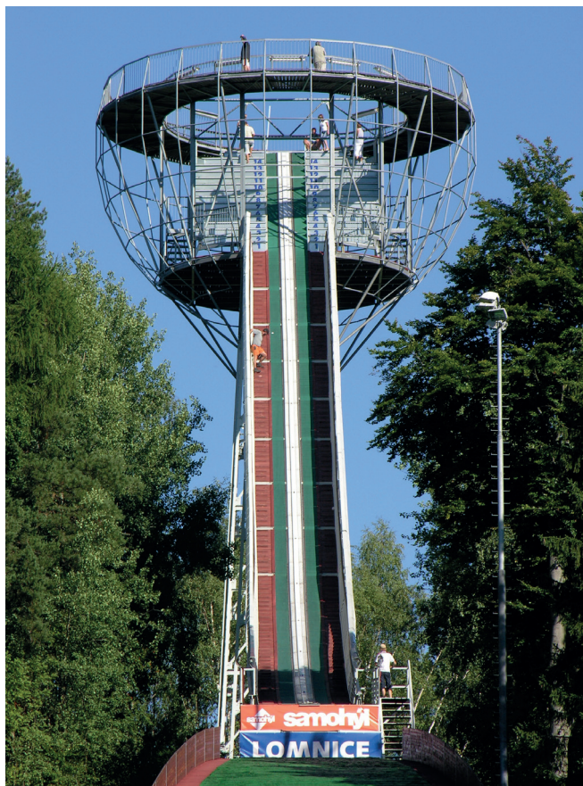
Rozhledna na skokanském můstku

Lomnice nad Popelkou, nám. – V Popelkách, rozc. ( – 1,3 km) – Rozhledna na skok. můstku ( – 2,6 km) – Zadní Popelka ( – 3,9 km) – Allainův kříž ( – 5,9 km) – Tábor, rozhl. – ( – 7,1 km) – Lomnice nad Popelkou ( – 9,9 km)