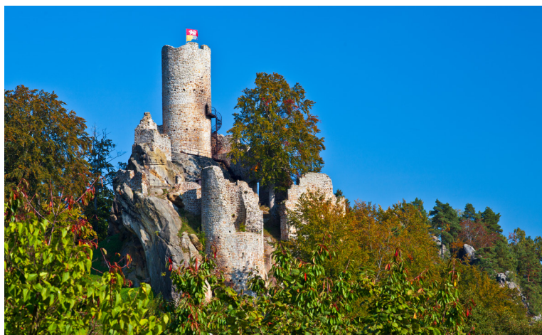
Zřícenina hradu Frýdštejn

S využitím vlaku lze výlet zkrátit či rozdělit na dvě části.